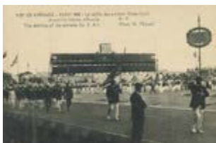
Délégation des États-Unis