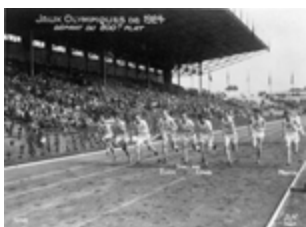
Départ du 800 mètres