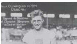
Harold Osborn saut en hauteur et décathlon

Illustration page de couverture : affiche promotionnelle C.N.O.S.F. Illustration pages intérieures : conçu par Archjoe - Freepik.com Conception et mise en page : C.R.O.S. de Bourgogne