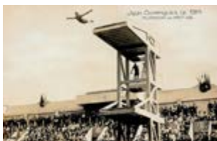
Plongeon de haut vol