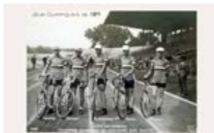
Équipe de France de cyclisme