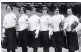
Les finalistes du fleuret