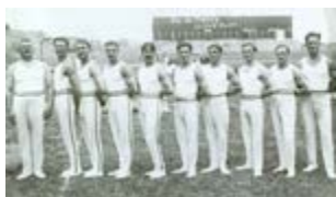
Équipe de France de gymnastique