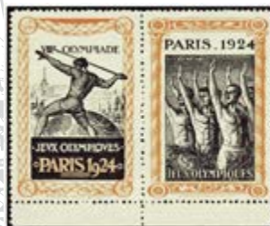
Timbres édités pour l'évènement